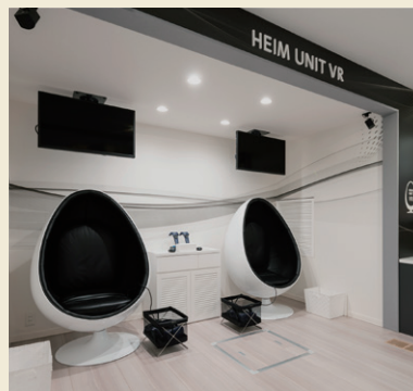
ミュージアム※ (体感型ショールーム)

※ミュージアム見学はセキスイハイムミュージアム・ハイムギャラリーパークからお選びいただけます。予約状況によりご希望の日時でのご予約をお受けできない場合がございます。