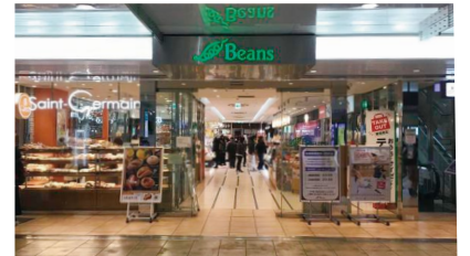
西川口駅構内Beans / 徒歩19分(約1,500m)