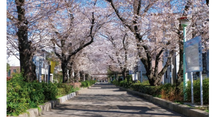
南町桜並木遊歩道 / 徒歩1分(約50m)