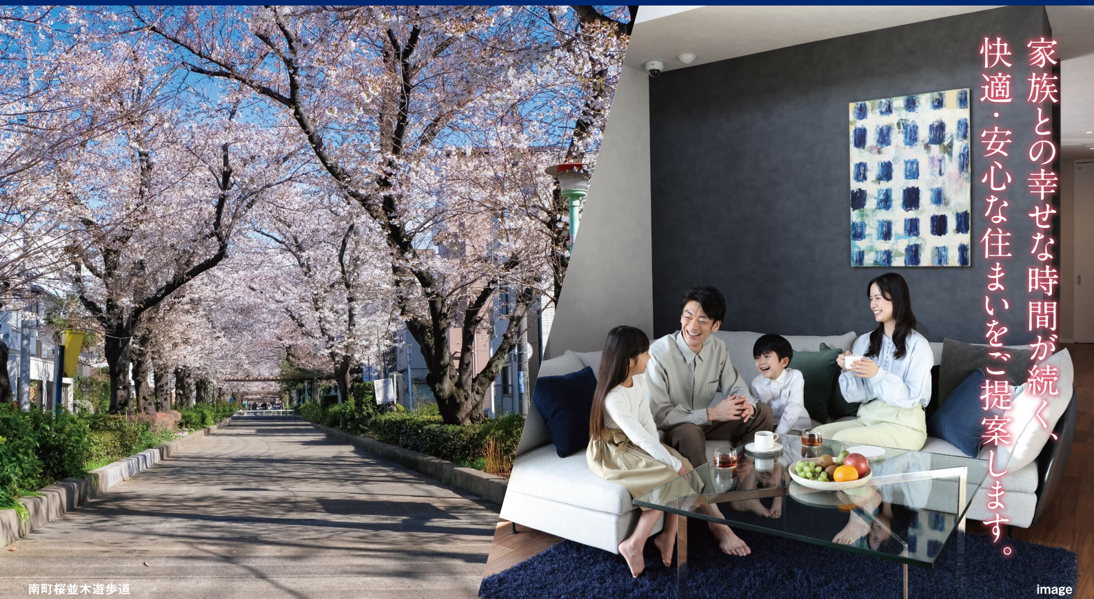
南町桜並木遊歩道