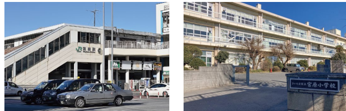
JR「宮原駅」／徒歩11分(約810m) 宮原小学校／徒歩11分(約860m)