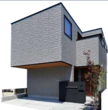
建物外観※令和5年5月撮影

四季を通じて明るさがうれしい、魅力の2階リビングプラン。 家事が楽になる動線に加え、収納、テレワークスペースも充実した邸。