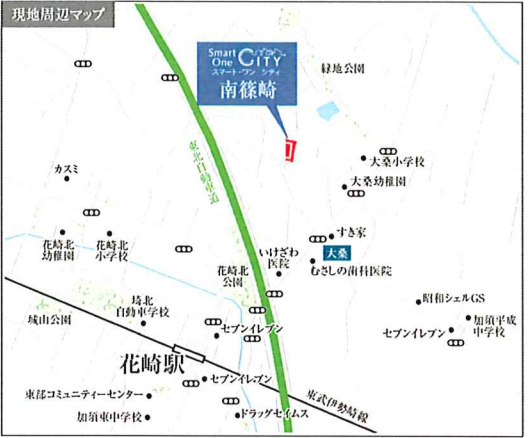
[カーナビには加須市南篠崎字南761-1付 近と入力ください]