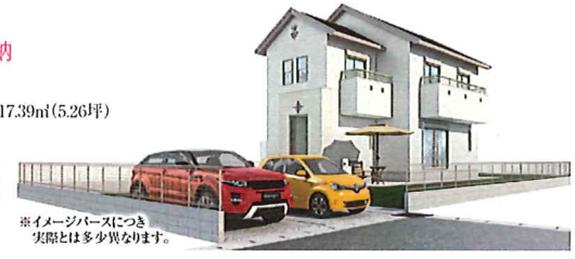
※イメージベースにつき 実際とは多少異なります。