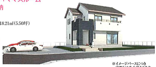
※イメージベースにつき 実際とは多少異なります。