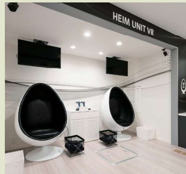
ミュージアム* (体感型ショールーム)

*ミュージアム見学はセキスイハイムミュージアム・ハイムギャラリーパークからお選びいただけます。予約状況によりご希望の日時でのご予約をお受けできない場合がございます。