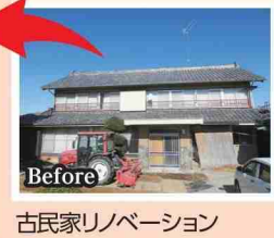
古民家リノベーション