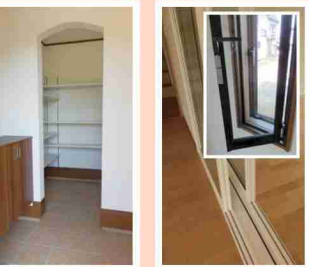
土間収納で花粉もウィルスも持ち込まない