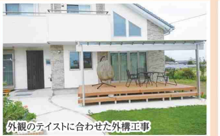
外観のテイストに合わせた外構工事