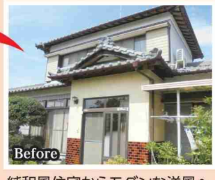
純和風住宅からモダンな洋風へ