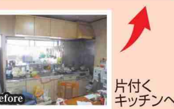
片付くキッチンへ

LIXIL TEPCOの建て得 ご存知ですか? ZEH(ゼッチ)とはネット・ゼロ・エネルギー・ハウスの略