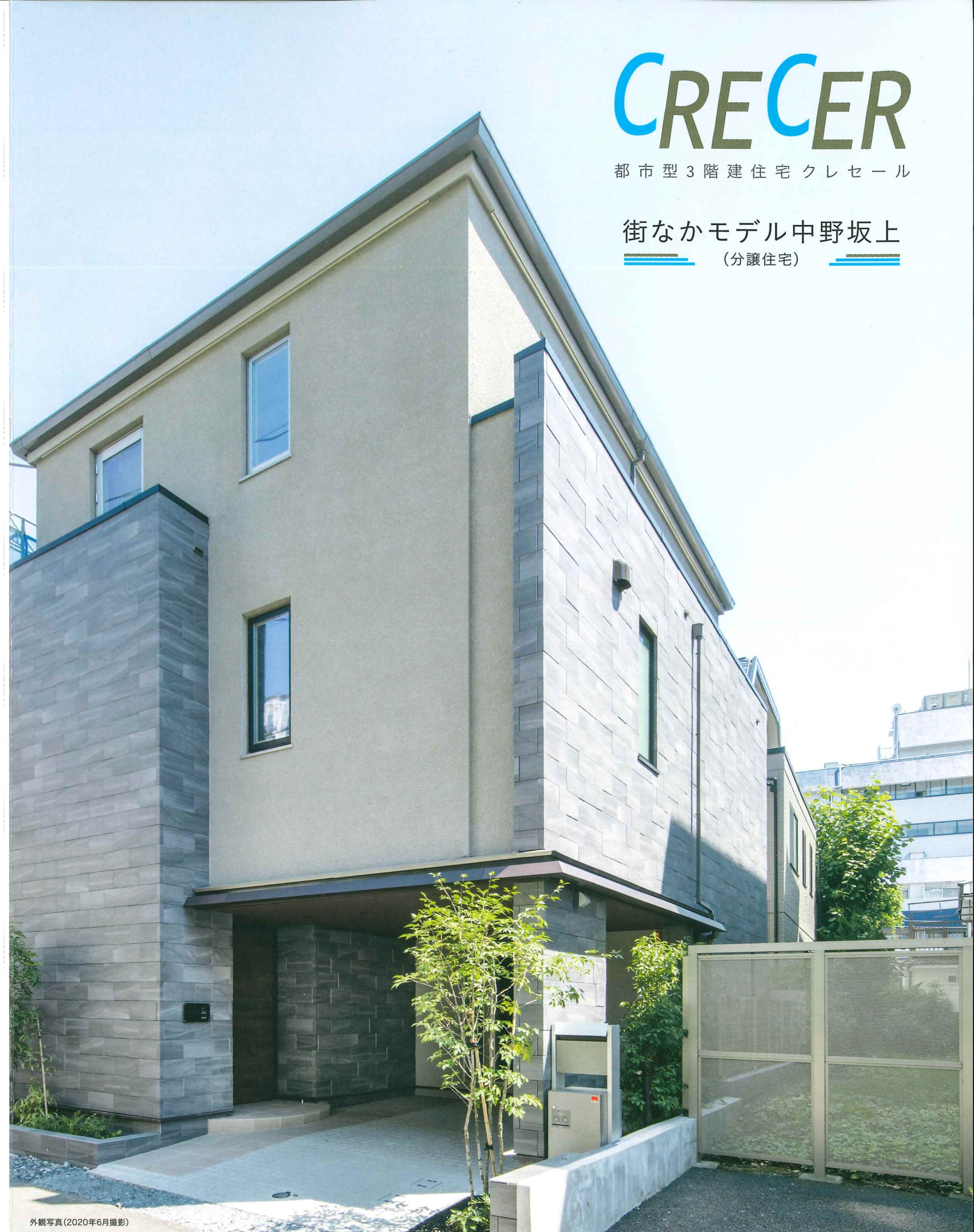
外観写真(2020年6月撮影)

(一社)日本ツープイフォー建築協会正会員 建設業許可/国土交通大臣許可(特-29)第8030号 宅地建物取引業者免許/国土交通大臣(11)第2531号