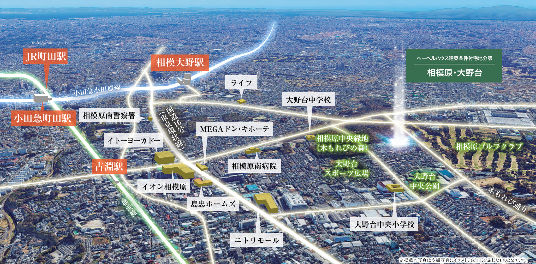
※掲載の写真は空撮写真にイラストCG加工を施したものとあります。