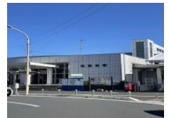
JR東鷺宮駅 約1.6km(徒歩20分)