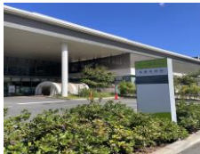
● 東鷲宮病院 約1.5km (車6分)