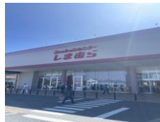
● しまむら(ベスタ東鷲宮店) 約1.5km (車6分)