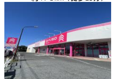
ダイソー(鷺宮店) 約280m(徒歩4分)