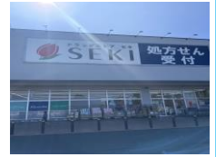
● セキ薬局(ベスタ東鷲宮店) 約1.5km (車6分)

〈イコトテラス東大輪 全体概要〉 ●所在地/埼玉県久喜市東大輪2036番1 他 ●交通/JR東鷲宮駅より徒歩20分 ●土地面積/305.06㎡(92.28坪)~328.39㎡(99.33坪) ●総区画数/6区画 ●販売区画数/5区画 ●用途地域/無指定 ●都市計画/市街化調整区域(34条11号) ●地目/宅地 ●設備/電気:有、ガス:無、上水道:引込有、下水道:引込有 ●私道負担/無 ●道路幅員/5m ●建蔽率/60%、容積率/200% ●開発許可番号/久指令都第2277号 ●土地の権利形態/所有権 ●販売価格/1,360万円~1,700万円 ●最高価格帯/1500万円台(3区画) ●取引態様/売主 ●取引条件有効期限/2024年1月31日