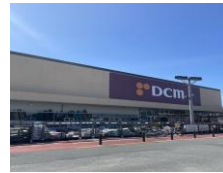
● DCM(東鷲宮店) 約1.5km (車6分)