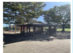
● 原山公園 約1.3km (徒歩17分)