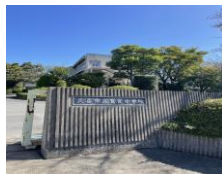
● 鷲宮中学校 約1.1km (徒歩14分)