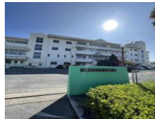
● 東鷲宮小学校 約1.8km (徒歩23分)