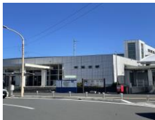
● JR東鷲宮駅 約1.6km (徒歩20分)