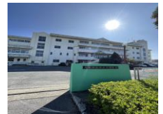
東鷺宮小学校 約1.8km(徒歩23分)