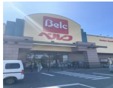
● ベルコ(ベスタ東鷲宮店) 約1.5km (車6分)