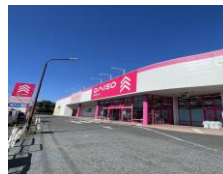
● ダイソー(鷲宮店) 約280m (徒歩4分)